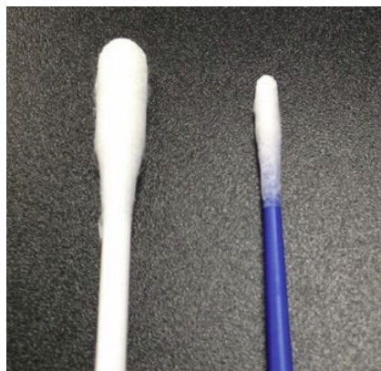
スワブ（大）とスワブ（小）の比較